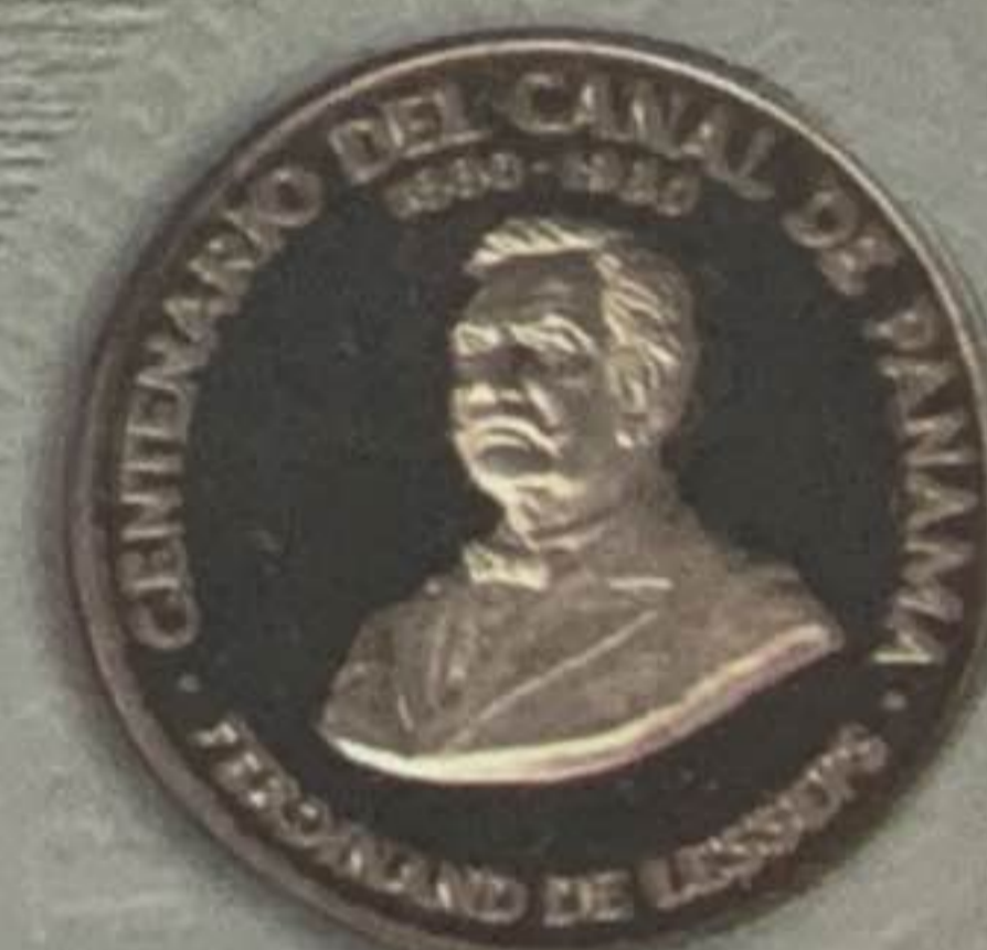
1980 - Centenario del Inicio de los Trabajos del Canal de Panamá 100 Balboas - Oro