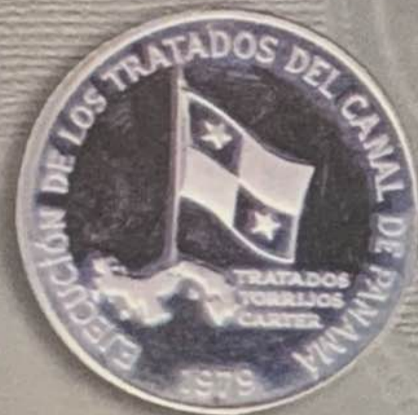
1979 - Ejecución de los Tratados del Canal de Panamá 5 Balboas - Plata