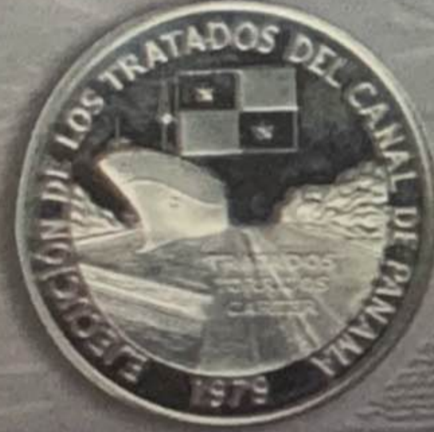
1979 - Ejecución de los Tratados del Canal de Panamá 10 Balboas - Plata