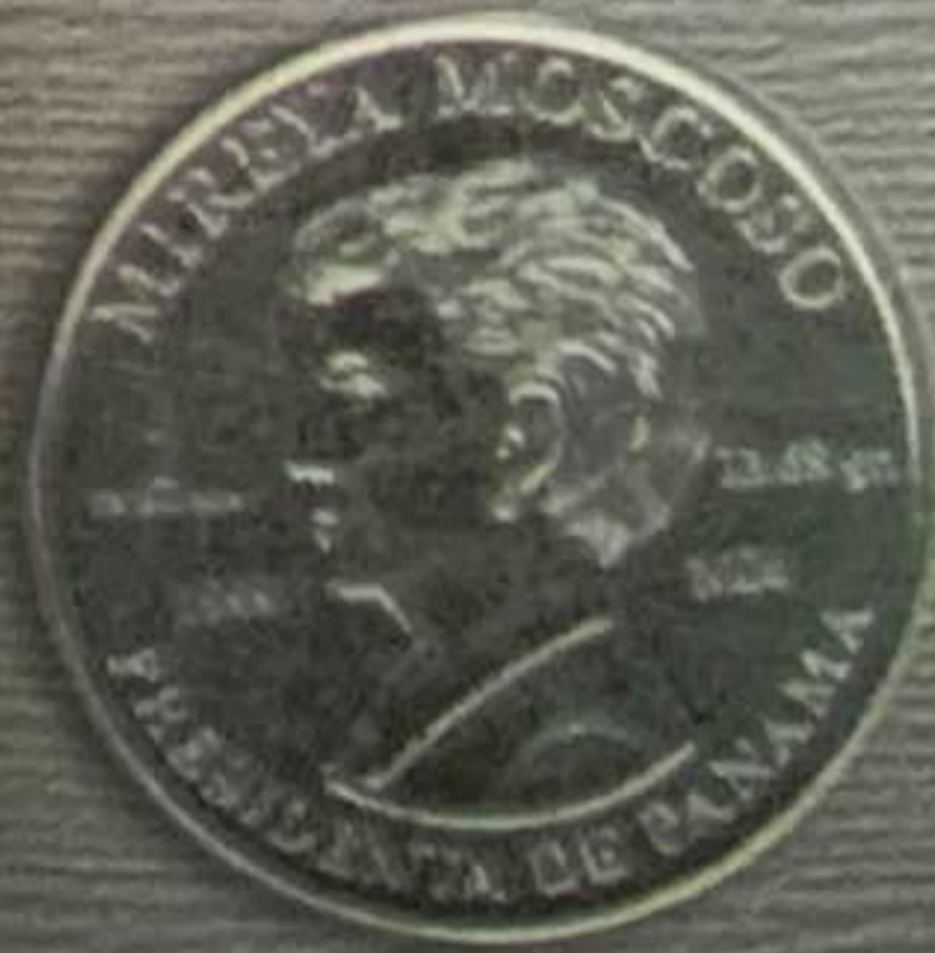
1999 - Reversión del Canal de Panamá 1 Balboa - Níquel