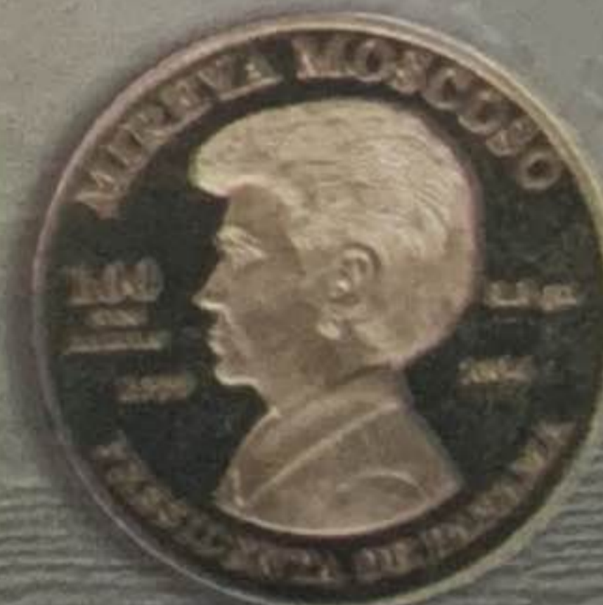
1999 - Reversión del Canal de Panamá 100 Balboas - Oro