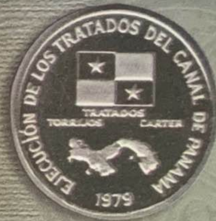
1979 - Ejecución de los Tratados del Canal de Panamá 200 Balboas - Platino