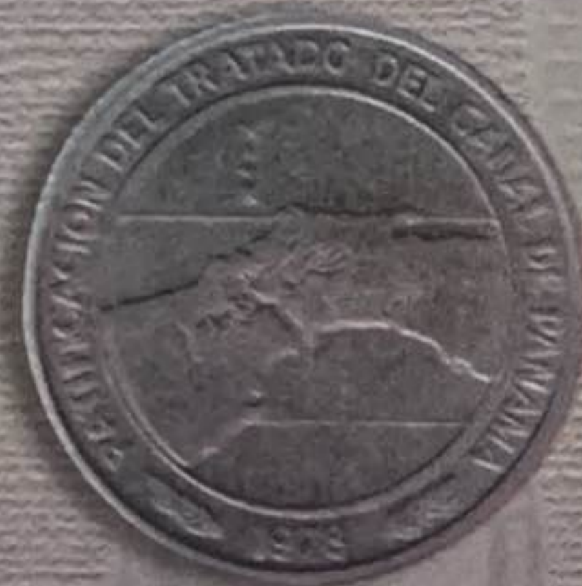
1978 - Ratificación del Tratado del Canal de Panamá 10 Balboas - Níquel