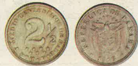
Dos y medio centésimos de 1918 (Extra fina)