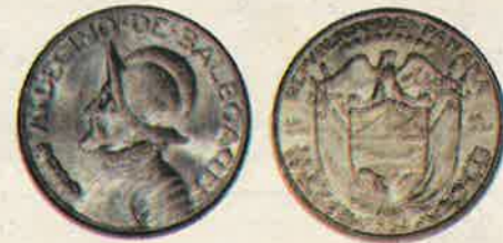
Un décimo de 1933 (Brillante sin circular)