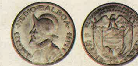
Medio Balboa 1934 (Brillante sin circular)