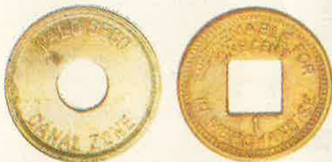
Un (1) Centavo