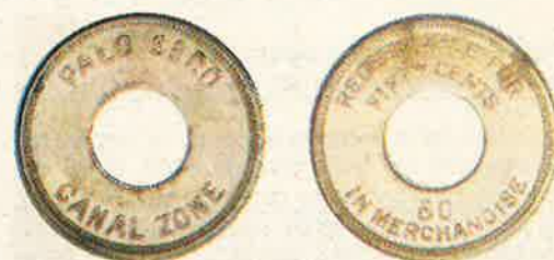
Cincuenta (50) Centavos

La monedas de 1 y 5 centavos fueron hechas de bronce, las monedas de 10, 25, 50 centavos y un dólar fueron hechas de aluminio. Cada moneda tenía una perforación en el centro y tenía aproximadamente el mismo tamaño que el equivalente en la moneda de Estados Unidos.