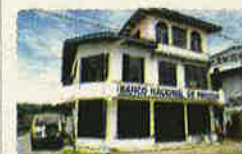
SUCURSAL CHIRIQUÍ GRANDE