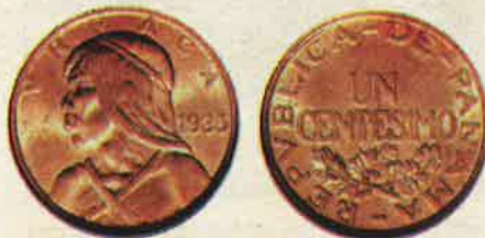
Un centésimo de 1935 (Brillante sin circular)

Ilustramos algunos ejemplares de la subasta,