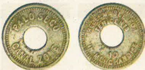
Diez (10) Centavos

En 1952 estas monedas fueron sacadas de circulación y destruidas posteriormente. Por suerte no todas fueron destruidas, las monedas que escaparon a la destrucción están en la actualidad en manos de coleccionistas y gracias a ellos podemos conocer más de la historia numismática de Panamá.