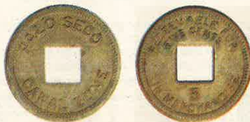
Cinco (5) Centavos

Las monedas tenían un diseño simple que decía "PALO SECO CANAL ZONE" en el anverso y el reverso decía "REDEEMABLE FOR xxxxxxxx IN MERCHANDISE". La denominaciones fueron de 1, 5, 10, 25, 50 centavos y un dólar.