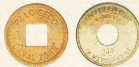
Un (1) Dólar

La monedas de 1 y 5 centavos fueron hechas de bronce, las monedas de 10, 25, 50 centavos y un dólar fueron hechas de aluminio. Cada moneda tenía una perforación en el centro y tenía aproximadamente el mismo tamaño que el equivalente en la moneda de Estados Unidos.