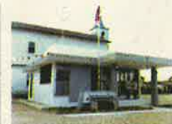
SUCURSAL SAN BLAS