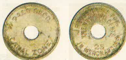
Veinticinco (25) Centavos

Fueron emitidas 2,000 monedas de un centavo y 1,000 de cada una de las otras denominaciones.