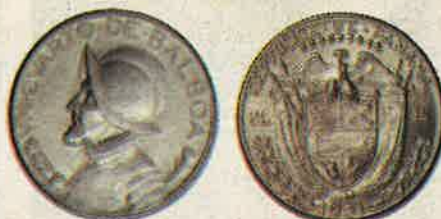
Un cuarto de 1931 (Brillante sin circular)