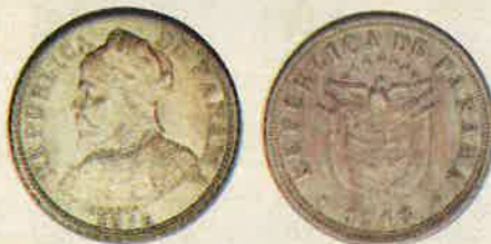
Cinco centésimos de 1916 (Brillante sin circular)